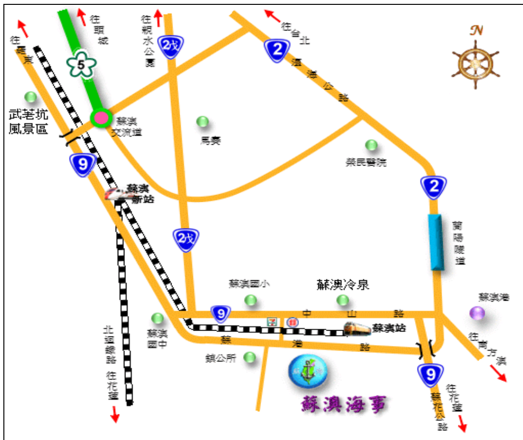
附圖一、承辦學校位置圖