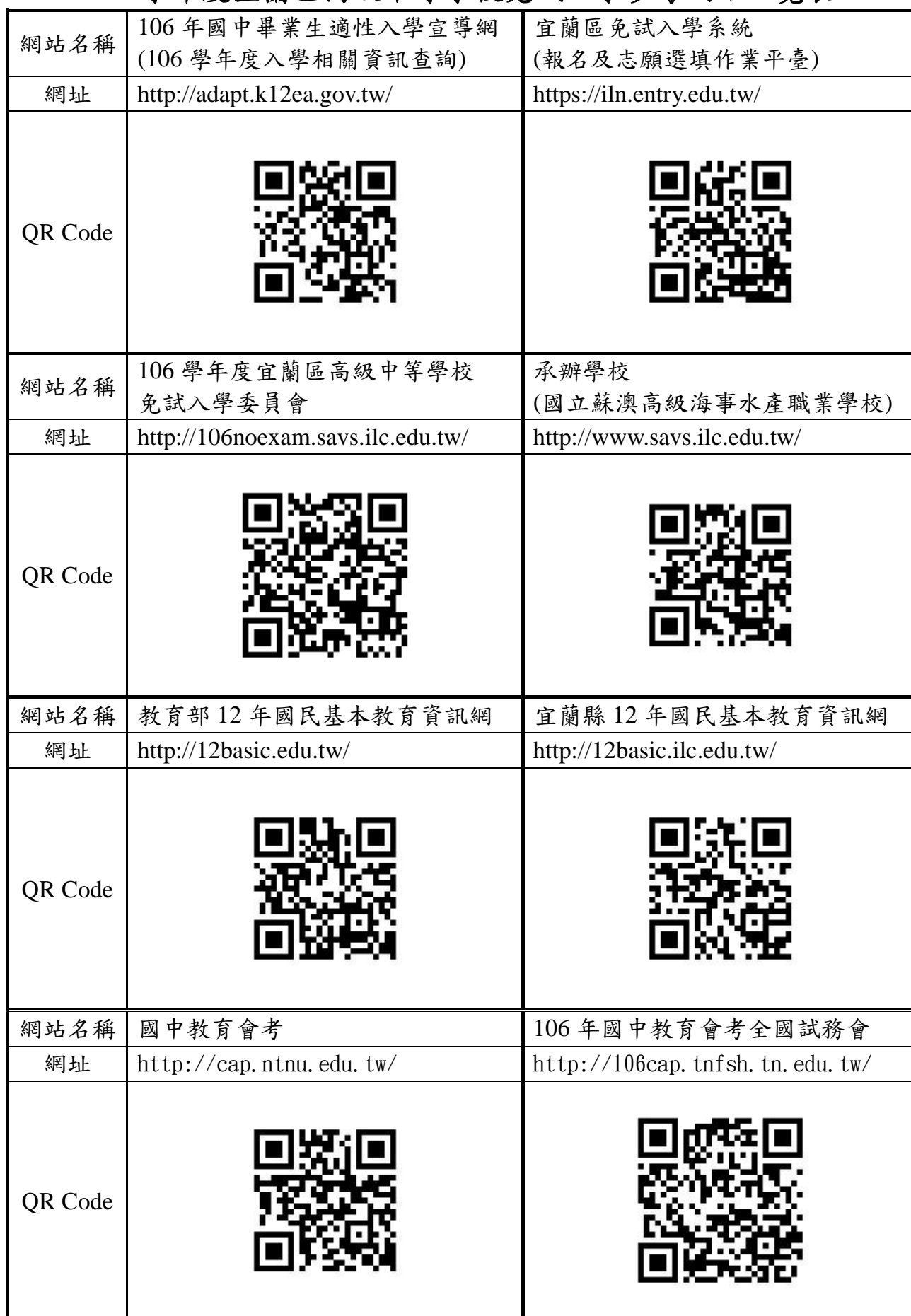
106 學年度宜蘭區高級中等學校免試入學參考網站一覽表